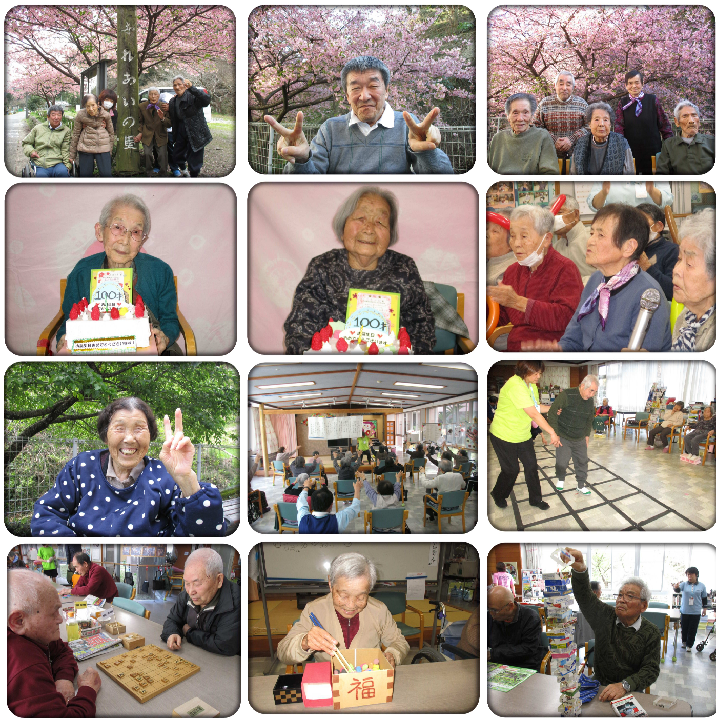
デイサービス：日帰りでご利用頂くサービスです。ご自宅まで送迎いたします。入浴や食事、機能訓練などを行います。

工作では壁飾り（季節の花）を作り、時には展示会に出品します。レクリエーション活動（ゲーム）では、普段淑やかな女性陣が男性顔負けの力量を発揮し恐るべし（笑）一面を垣間見ることもあります。毎日の体操は笑いが絶えず人気で、歌と体操を同時に行うことで、認知症予防や身体機能維持を楽しみながら行うことができます。ご興味のある方、一緒に楽しく参加しませんか？お試参加もごさいますので、お気軽にお問い合わせ下さい。お待ちしております。